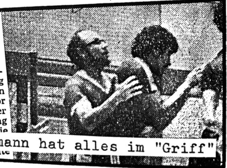
Hermann hat alles im "Griff"

si. Erding — In einem vorentscheidenden Spiel um den B-Klassen-Aufstieg siegten die Altenerdinger Handballer in Moosburg mit 13:8 (7:4). Drei Spiele vor Saisonende führt die SpVgg nun mit vier Punkten. Eine nahezu fehlerfreie Deckung gab den Altenerdingern Rückl- Die SG Moosburg fand einfach kein