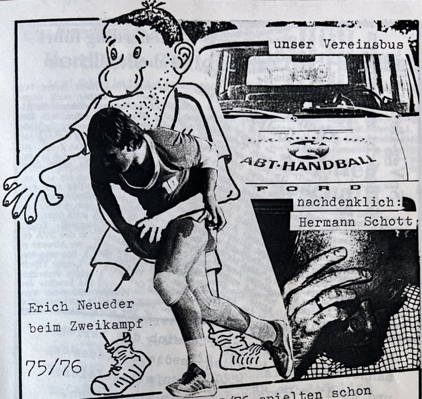
Erich Neueder beim Zweikampf